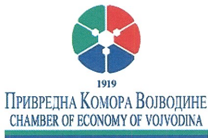
1919 ПРИВРЕДНА КОМОРА ВОЈВОДИНЕ CHAMBER OF ECONOMY OF VOJVODINA