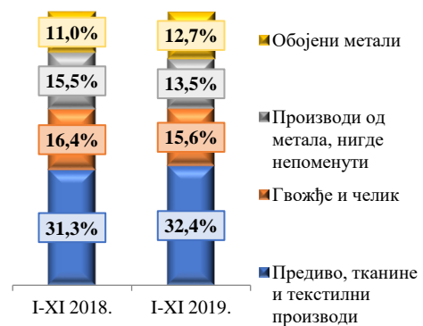
Прва четири одсека у оквиру сектора Израђени производи сврстани по материјалу

У оквиру сектора Израђени производи сврстани по материјалу највеће учешће од 32,4% има одсек Предиво, тканине и текстилни производи, који и у укупном увозу, посматрано по одсецима заузима прво место са учешћем од 11,0%.