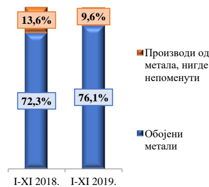
Прва два одсека у оквиру сектора Израђени производи сврстани по материјалу

У оквиру сектора Израђени производи сврстани по материјалу највеће учешће од 76,1% има одсек Обојени метали, који и у укупном увозу, посматрано по одсецима заузима прво место са учешћем од 36,8%.