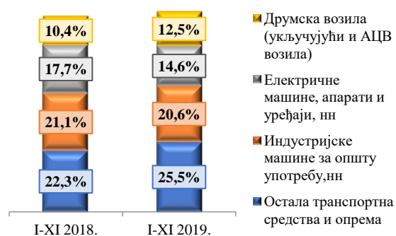
Прва четири одсека у оквиру сектора Машине и транспортни уређаји

Посматрано по секторима СМТК у увозу из Словеније, у првих једанаест месеци 2019. године, највеће учешће од 30,0% има сектор Машине и транспортни уређаји, који је за 12,1% већи у односу на исти период 2018. године. У оквиру овог сектора највеће учешће од 25,5% има одсек Остала транспортна средства и опрема.