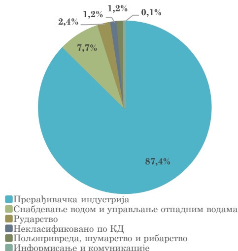
Структура увоза АП Војводине из Босне и Херцеговине, јануар 2023. године

У увозу АП Војводине из Босне и Херцеговине највеће учешће има сектор Прерађивачке индустрије (87,4% у јануару 2023) , са повећањем вредности увоза у односу на јануар 2022. године за 17,4%. Снабдевање водом и управљање отпадним водама је сектор који се налази на другом месту према вредности оствареног увоза из Босне и Херцеговине, са учешћем од 7,7% у јануару 2023. и међугодишњим повећањем вредности од 105,1%. На трећем месту је увоз сектора Рударство (учешће 2,4% у укупном увозу АПВ из БиХ у јануару 2023), а који је забележио међугодишње смањење од 49,0%.