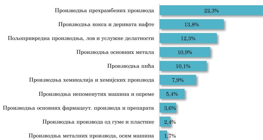
Водеће делатности у извозу АП Војводине у БиХ, јануар 2023. године (кумулативно учешће 90,2% у укупном извозу АПВ у БиХ)

Посматрано по артиклима, у јануару 2023. године, из Војводине у БиХ највише је извезено Моторног бензина (Pb=<0,013g/l, RON>=95<98, без биодизела) , у вредности од 3,6 млн евра и са учешћем од 8,8% у укупном извозу АП Војводине у БиХ (а чини 32,3% укупног војвођанског извоза датог артикла у посматраном периоду). У