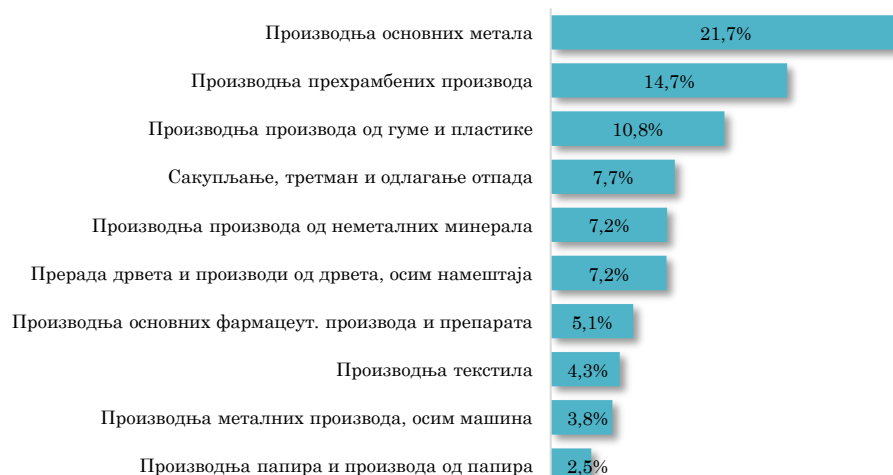
Водеће делатности у увозу АП Војводине из БиХ, јануар 2023. године (кумулативно учешће 84,9% у укупном увозу АПВ из БиХ)

Посматрано по артиклима, најзначајнији увозни производ из Босне и Херцеговине у Војводину је Челик бетонски, ТВ, ребрасти, у шипкама , са учешћем од 7,8% у укупном војвођанском увозу из БиХ, који је међугодишње забележио повећање вредности од 114,7%. Увоз Челика бетонског, ТВ, ребрастог, у