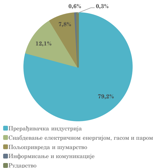
Структура извоза Србије у Босну и Херцеговину, јануар 2023. године