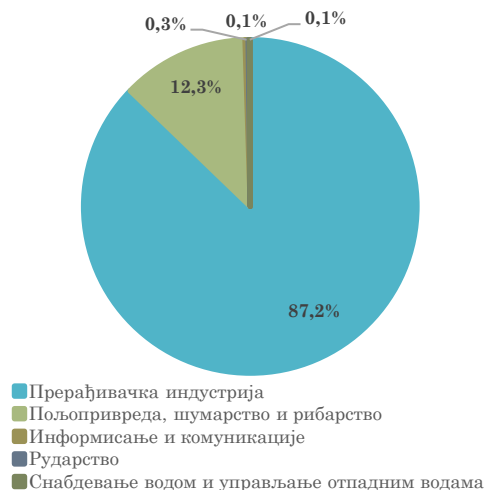
Структура извоза АП Војводине у Босну и Херцеговину, јануар 2023. године

Посматрано по секторима делатности, у извозу АП Војводине у Босну и Херцеговину највеће је учешће Прерађивачке индустрије (87,2% у јануару 2023) , која ја у односу на јануар прошле године забележила смањење вредности извоза у БиХ од 23,3% (вођено смањеним извозом кокса и деривата нафте од 70,3% мг). На другом месту налази се извоз сектора Пољопривреда, шумарство и рибарство (учешће 12,4%) , који је забележио међугодишњи раст извоза од 12,2%. Остали сектори делатности учествују у укупном извозу АП Војводине у БиХ са по мање од 0,5%.