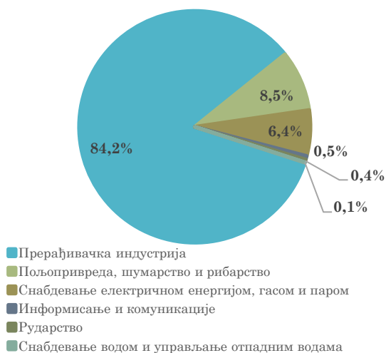
Структура извоза Србије у Босну и Херцеговину, јануар - март 2023. године