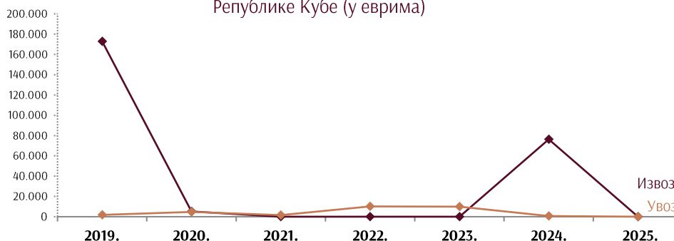
Спољнотрговинска робна размена АП Војводине и Републике Кубе (у еврима)

Извоз у Кубу је у 2024. години износио 76,3 хиљаде евра (стопостотни извоз на нивоу целе државе у Кубу током 2024. године реализован је у АП Војводини), док је увоз из Кубе на територији АП Војводини у 2024. износио свега 647 евра .